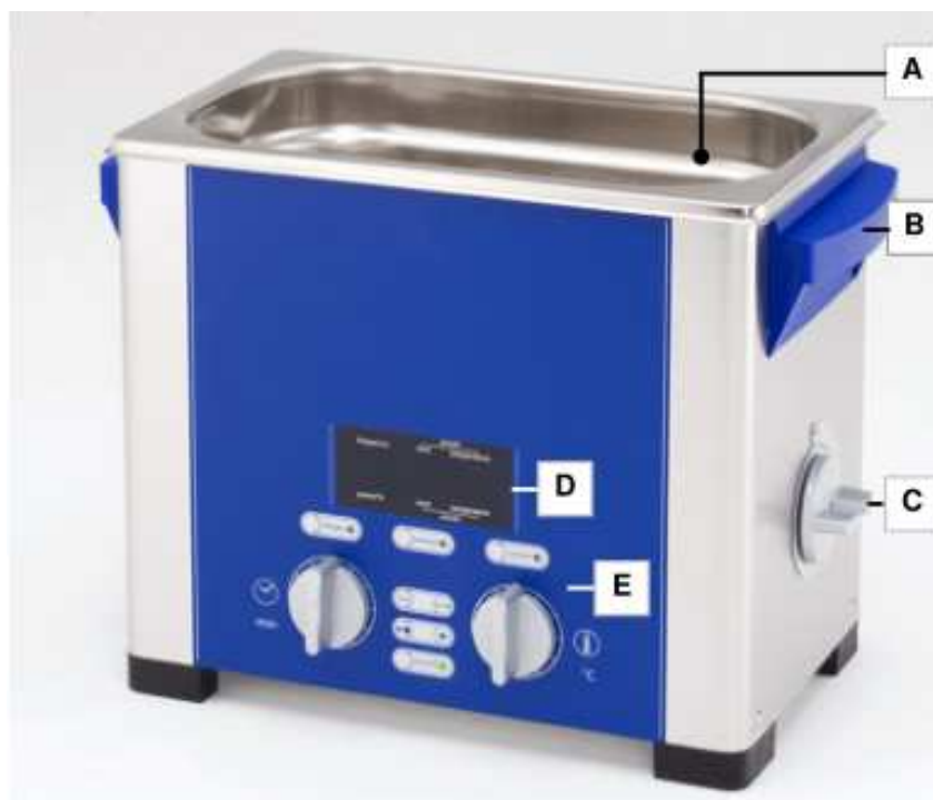
Slika 4.4 Sprednja stran/pogled s strani