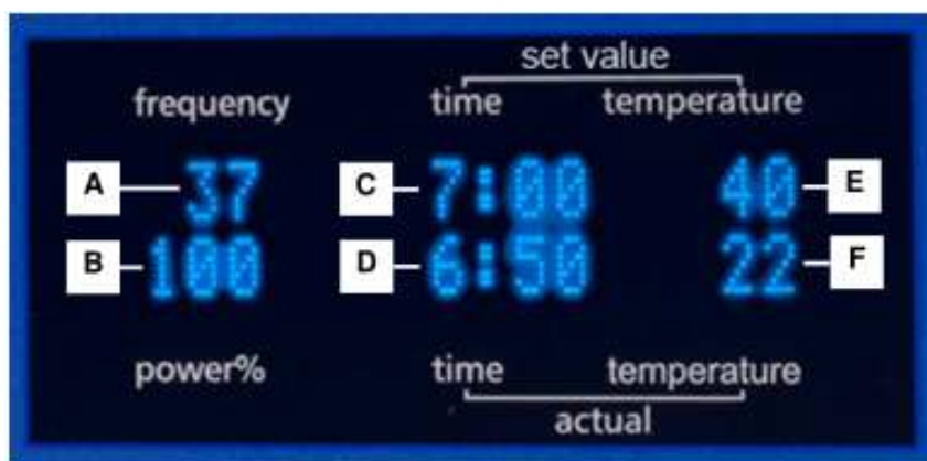
Slika 4.8 Prikaz na monitorju (primer)