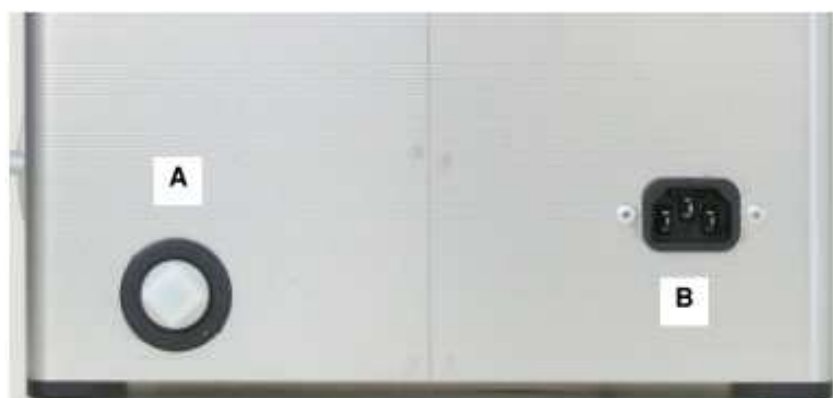
Slika 4.5 Zadnja stran